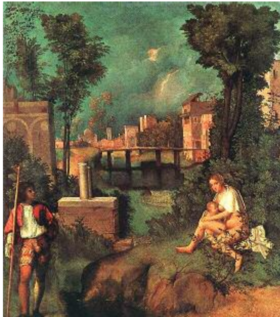
جیورجیونی / Giorgione